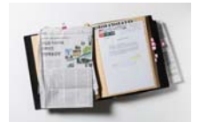
APAP 디지털 아카이브 (www.apap.or.kr)에서도 APAP의 소장품과 각종 자료들을 만날 수 있습니다.

안양파빌리온에서는 운영 프로그램과 연계된 전시물들을 선보이고 있다. 그 첫 번째로 전 세계의 '사회 참여적 예술' 작업들을 선별하여 모은 <리빙 애즈 폼(더 노마딕 버전)>을 소개한다. '사회 참여적 예술'은 공공예술과 많은 공통점을 가지고 있는 장르로서 참여와 대화, 그리고 공동체와의 관계를 중요시하는 예술활동을 말한다. 뉴욕의 공공예술 기획단체 '크리에이티브 타임(CREATIVE TIME)'과 '인디펜던트 큐레이터스 인터내셔널(CI)', 그리고 여러 협력 기관이 함께 만들어 나가는 이번 전시를 통해 삶 자체를 예술로 형상화하는 작가들의 이야기를 만나보자.