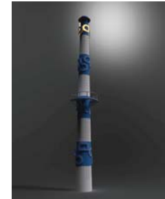
안양 메모리 타워(작품예상 이미지) : 정충모

(구)유유제약 건물 철거 과정에서남게 된 24개의 기둥을 활용하여 '흔(거북 귀)'자와 점차 사라져가는 세계의 문자들로 구성된 정원이 조성된다.