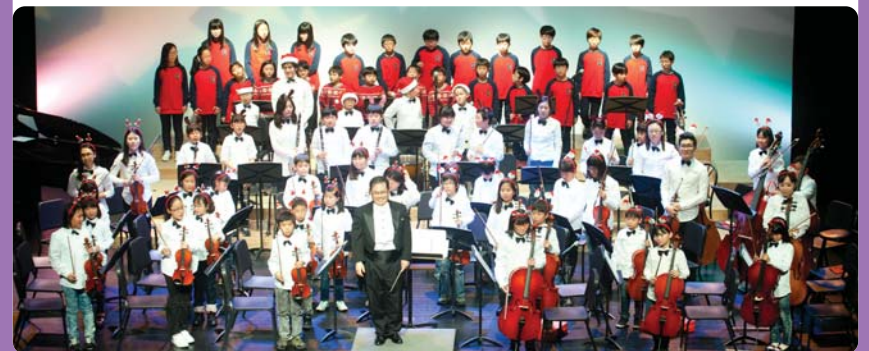
*꿈의 오케스트라는 문화체육관광부와 한국문화예술교육진흥원이 지원합니다.