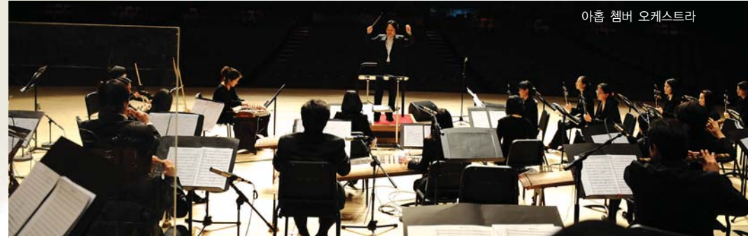
아흔 챔버 오케스트라