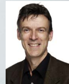
이바르 안톤 와고르(피아노)