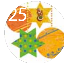
25 회원가입 안내