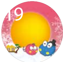
19 안양역사관 설날 교육 프로그램 우리우리 설날 Ⅲ