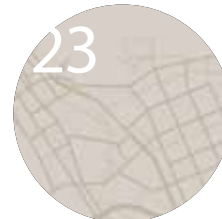
23 오시는 길