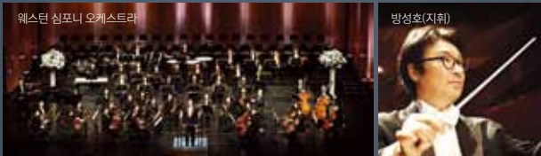
웨스턴 심포니 오케스트라

1.19(토) 오후 7시 안양아트센터 관악홀 관람료 VIP석 50,000원 R석 20,000원 S석 10,000원 (GOLD-NARI 30% 할인) 출연 웨스턴 심포니 오케스트라, 방성호(지휘), 임태경(크로스오버 테너), 김수연(소프라노)