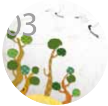
03 신년 인사말

2013 Vol.01 WINTER ART & CULTURE MAGAZINE TOAST