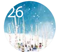
26 AFCA CALENDAR (1월-3월)