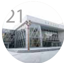
21 세 돌과 네 돌 사이에서