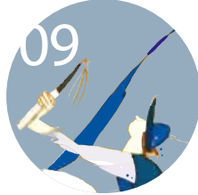
09 2013 이판사판 콘서트