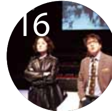
16 한빛 연극시리즈 I 그와 그녀의 목요일