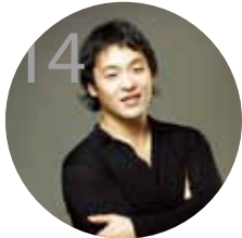
14 디토 오케스트라 오페라 콘서트 라 트라비아타