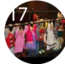
17 우리 동네 공연장 여행 안양아트센터