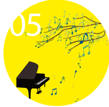
05 2013 평촌아트홀 아침음악회 그 남자의 초대